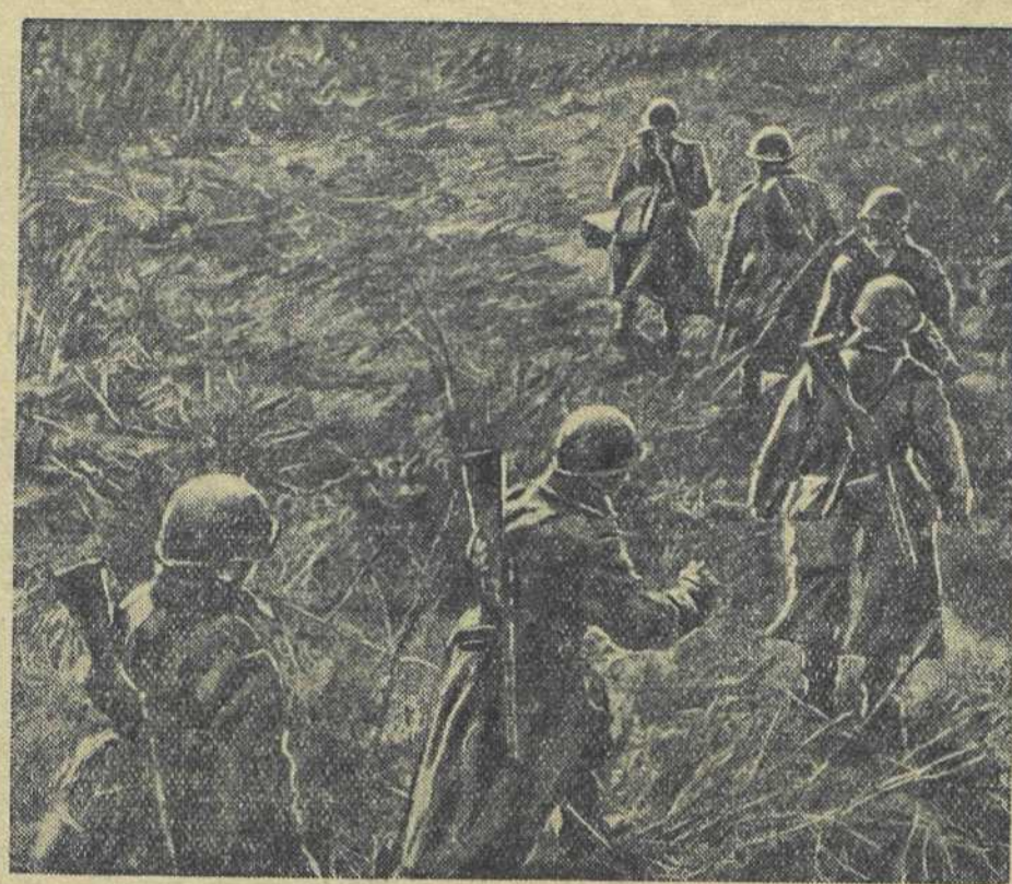
ЗАПАДНЫЙ ФРОНТ. Автоматчики гвардейцы выходят на боевую операцию.

Колхоз «ХИ лет Октября» Горьковского района Горьковской области.